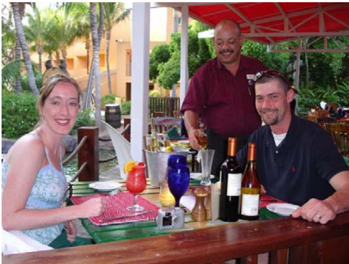
un gran prijs di US $ 19.95 mas e cargo pa servicio.

Mientras cu e menu por varia algun anochi, e Fiesta Mexicano cu ta ser sirbí na Laguna tur Diarazon, semper ta tuma lugar entre 6.00 p.m. y 10.00 p.m. na